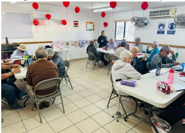
Fotografía 11. Casa de los Abuelos Apache