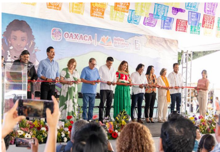
Fotografía 1. Inauguración FIELO 2025